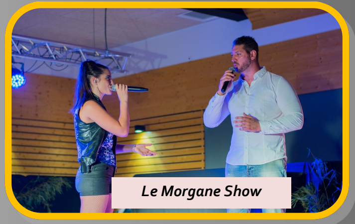
Le Morgane Show

Le Morgane Show est un spectacle dynamique existant depuis 3 ans, ses 2 chanteurs animeront votre soirée en vous proposant des morceaux allant des années 70 à aujourd'hui !