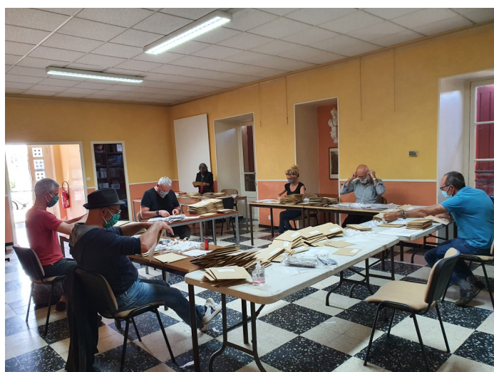
Atelier mise sous enveloppe des masques à la Mairie par les élus