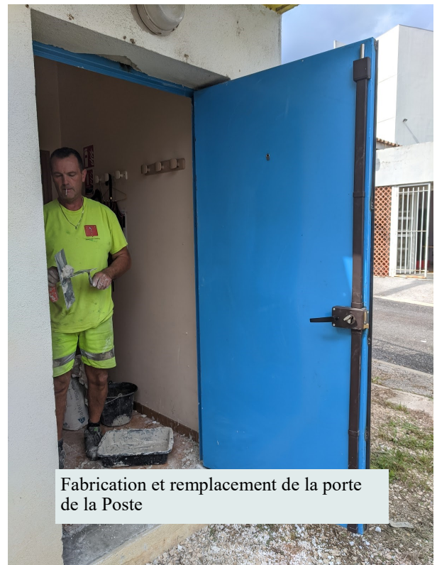
Fabrication et remplacement de la porte de la Poste