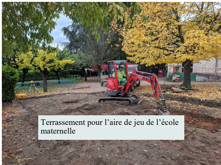
Terrassement pour l'aire de jeu de l'école maternelle