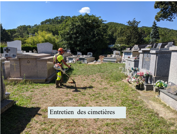
Entretien des cimetières