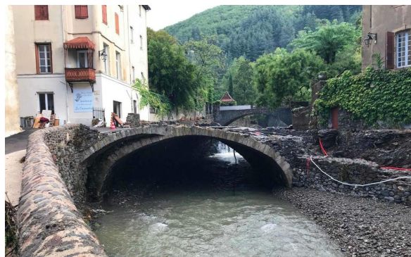
A Valleraugue, commune de 1 000 habitants, sur les contreforts du Mont-Aigoual, où sont tombés jusqu'à 450 millimètres d'eau en douze heures, les dégâts matériels sont importants

Il semblerait qu'une majorité de communes soient du même avis. La minorité de blocage doit être réunie pour empêcher le transfert de l'urbanisme à l'agglomération.