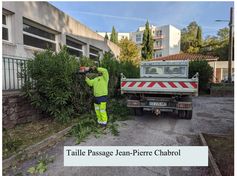
Taille Passage Jean-Pierre Chabrol