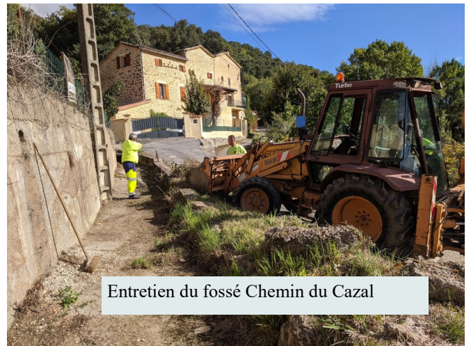
Entretien du fossé Chemin du Cazal