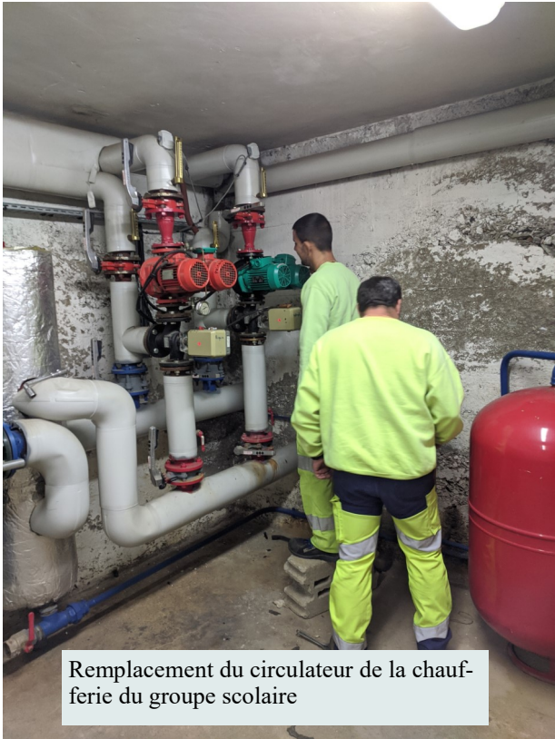
Remplacement du circulateur de la chaufferie du groupe scolaire