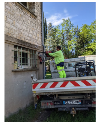
Création de ventilation sur les logements communaux