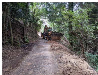
Réparation du chemin de Gaujouse partiellement éboulé