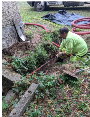
Consuel et mise aux normes électriques de l'alimentation du local des jardins du Galeizon