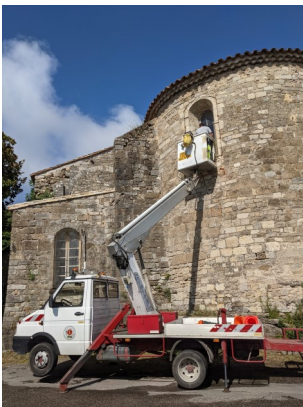
Réparation de la fenêtre de l'église cassée avec la tempête