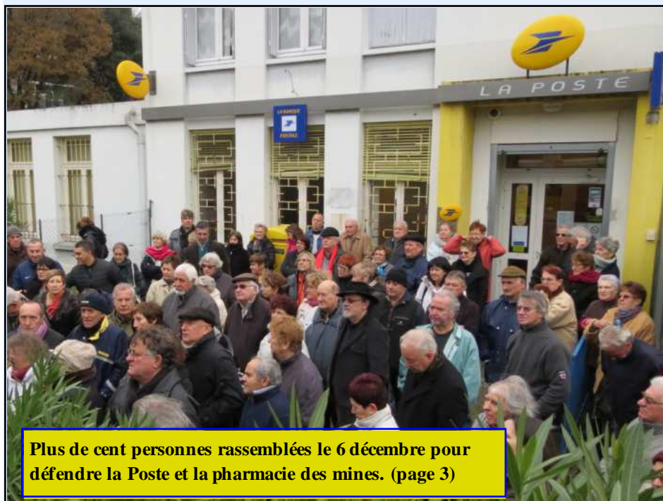
Plus de cent personnes rassemblées le 6 décembre pour défendre la Poste et la pharmacie des mines. (page 3)